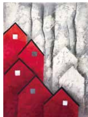
「旅の記憶」/ 60 × 80cm / 糊染・綿布