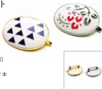
サイズ: 約 4.5 × 3.5cm