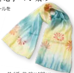
サイズ: 約 40 × 160cm