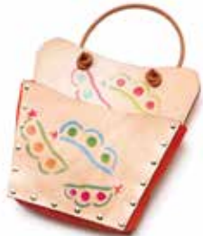
サイズ: 約 25 × 18cm