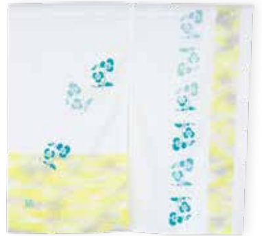
サイズ: 約 80 × 100cm