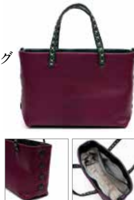
サイズ: 約 20 × 15 × 8cm