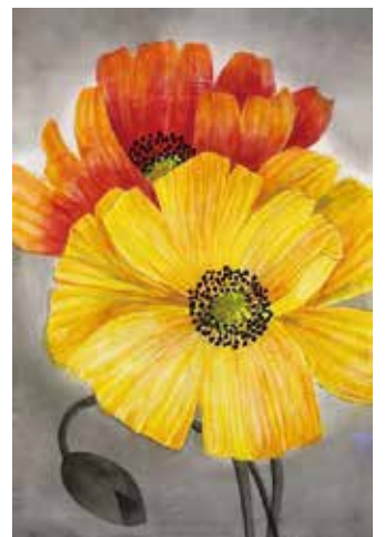
サイズ: 約 35 × 65cm / シルク紬