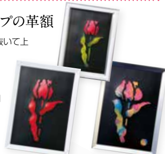
サイズ: 2L判 (約 12.7 × 17.8cm)