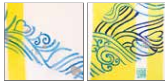
サイズ: 約 45 × 200cm