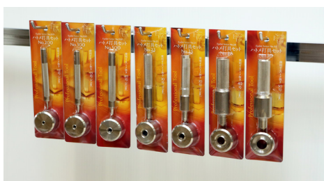
商品展開時、7種で約幅 500mm