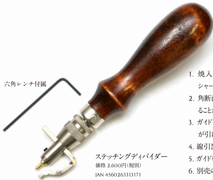
ステッチングディバイダー 価格 2,600円(税別) JAN 4560263313171

手縫いやレースかがり等のガイドライン引きに最適です。価格は2,600円(税別)です。先端替刃も別途発売します。