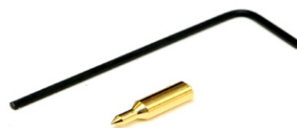
ステッチングディバイダー用替刃 価格 1,100円(税別) JAN 4560263313188