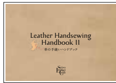
▲手縫いの基本を網羅した「手縫いハンドブックⅡ」