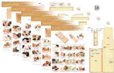
NEW! ▲6種類の新作型紙付き