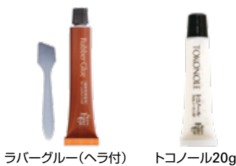
ラバークルー(ヘラ付) トコノール20g

従来品のボンドG17から、より強い皮革接着力を持つ「ラバークルー(専用ヘラ付)」に、ミニボトル容器のトコノールから「チューブタイプのトコノール(20g)」に変更しました。ラバークルーは小物制作に最適な合成ゴム系接着剤で、専用のヘラが付属します。トコノールは適量を取りやすいチューブタイプです。