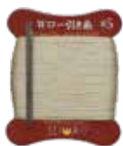
Wロー引き糸 #5ベージュ

スムーズ糸から、より革に馴染み、糸通り・取りに優れたWロー引き糸 #5ベージュに変更しました。