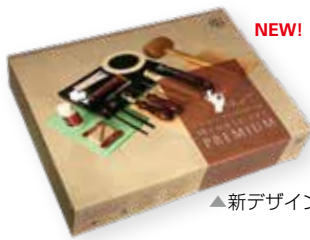
▲新デザインのパッケージ