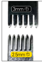
▲菱目打のピッチ比較 2.5mm(下)と3mm(上)