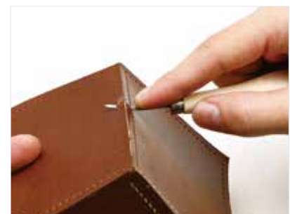
駒合わせ縫い、挿み合わせ縫い、すくい縫い等で、位置を合わせて縫い穴をあけます。刃先の太さは「ひしきりNo.3(大)」相当。